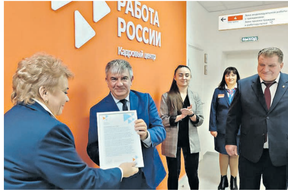
Церемония открытия современного кадрового центра «Работа России» прошло 20 декабря в городе Грайвороне.

ЦЕНТР ЗАНЯТОСТИ НАСЕЛЕНИЯ ИЗМЕНИЛСЯ В РАМКАХ НАЦИОНАЛЬНОГО ПРОЕКТА «ДЕМОГРАФИЯ»