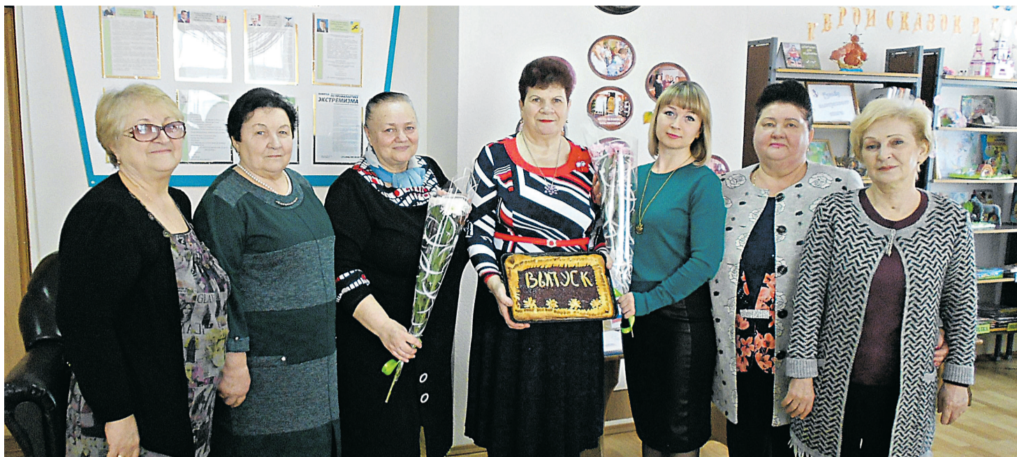
Выпуск группы по обучению компьютерной грамотности