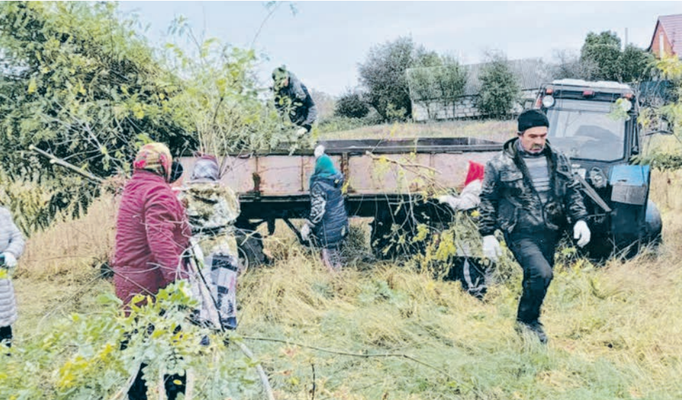
Жители села Головчино провели масштабные субботники на гражданском кладбище.