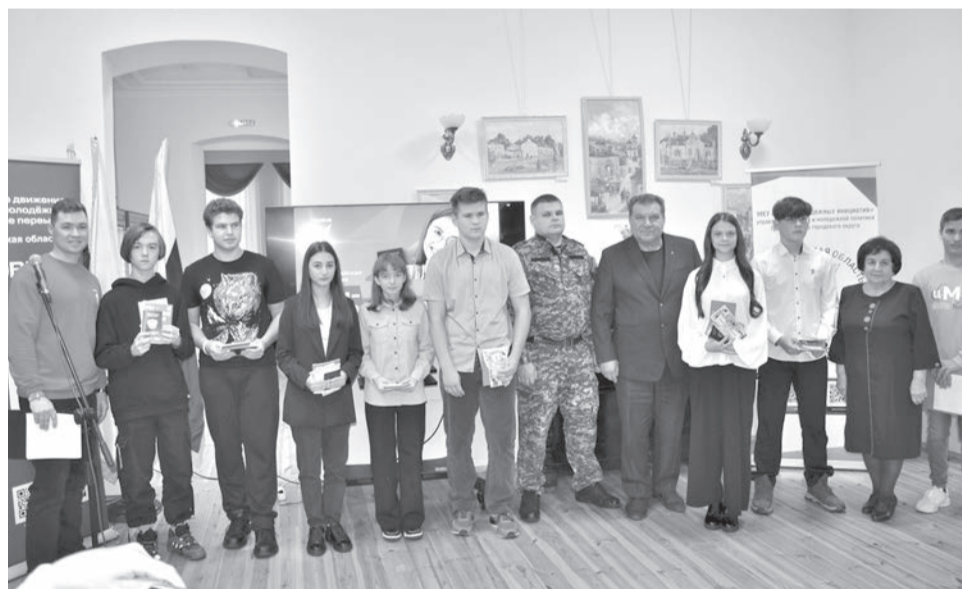
Семь учеников школ округа получили паспорт в канун Дня народного единства.

Событие состоялось в рамках Всероссийской акции «Мы – граждане России!» при участии активистов Российского движения детей и молодежи «Движение Первых». Церемония вручения приурочена ко всенародному празднику.