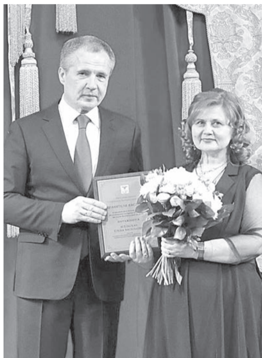
Церемонию награждения ко Дню работника культуры украсил праздничный бал.