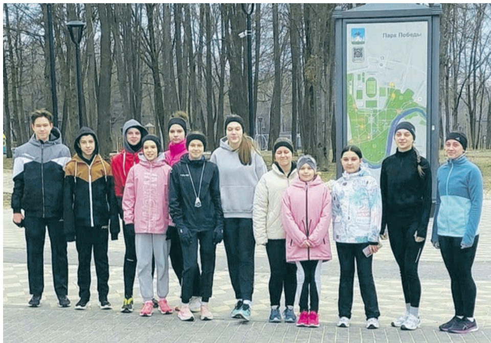
Двенадцать воспитанников отделения «лёгкой атлетики» спортшколы округа прибыли на тренировочные сборы в город Орёл.

Первое занятие состоялось 25 марта. Тренировки продлятся в течение трёх недель. Они будут проходить под руководством преподавателя спортшколы округа Сергея Жупиёва. За время подготовительного процесса ребята укрепят физическую закалку, повысят спортивные показатели и достойно представят городской округ на областных соревнованиях. С учётом отработанных навыков грайворонцы добьются и установят личные и районные рекорды.