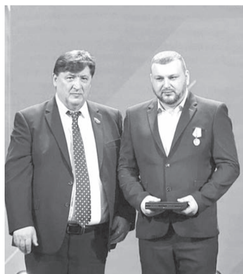
Шестеро жителей округа получили награды.