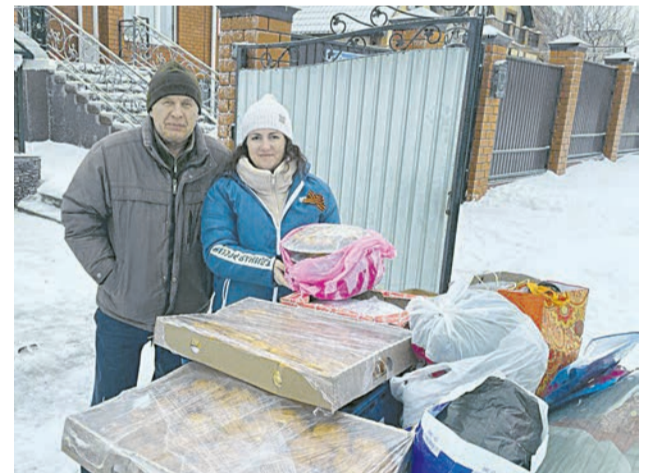
ФОТО УЧАСТНИЦ ЖЕНСКОГО КЛУБА

Досрочная подписка С 1 февраля по 31 марта проводится