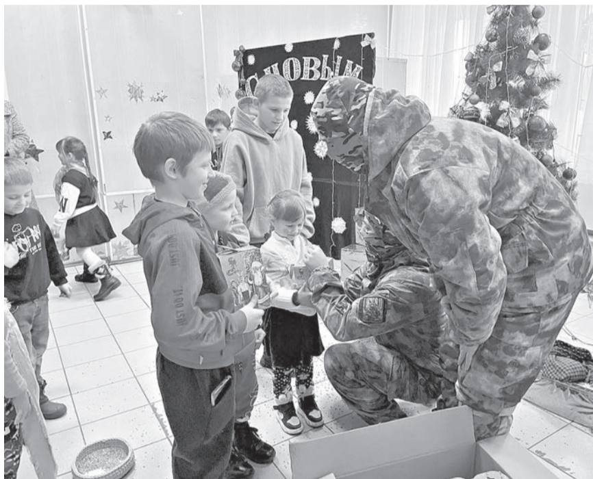
ФОТО: СОЦИАЛЬНО-РЕАБИЛИТАЦИОННЫЙ ЦЕНТР ДЛЯ НЕСОВЕРШЕННОЛЕТНИХ