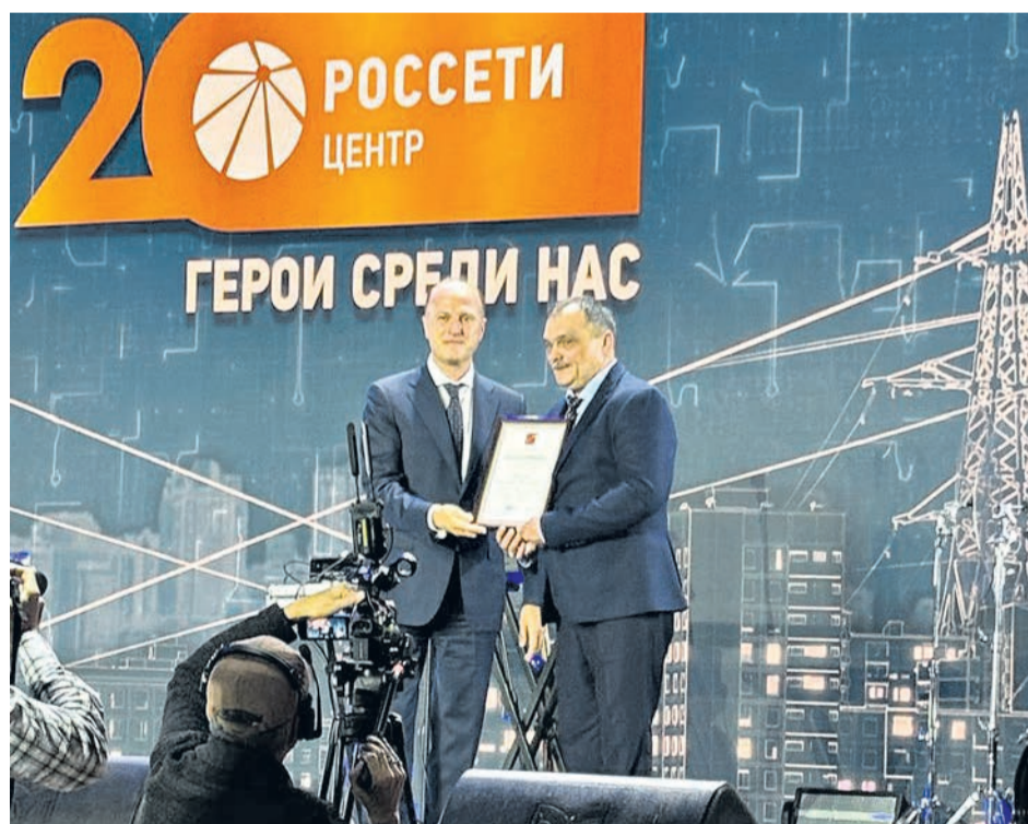
Награждение сотрудников ПАО «Россети Центр» — «Белгородэнерго» в Москве